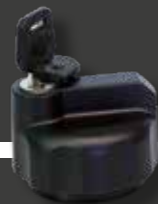
EXP-FC-1100001 Tapón del depósito universal, bloqueable € 32,30