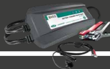
PC_SPI2 Cargador de batería de 6 / 12V 2A incl. cable € 95,90