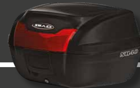
141034 Caja superior 40L € 140,20