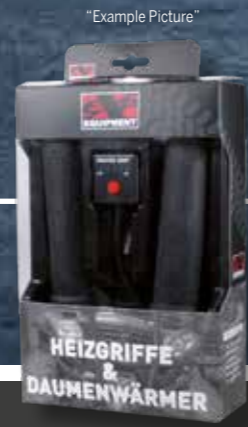
EXP-HG-110002 Conjunto para calentamiento de mango EXP € 69,50

En las siguientes páginas encontrará una pequeña selección de nuestro programa de accesorios. ¡Para obtener más información dirígete a tu distribuidor! www.ksr-moto.com