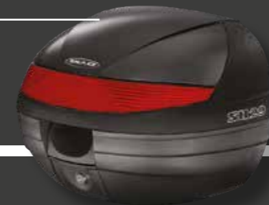
141117 Caja superior 29L € 80,40