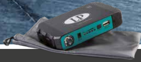
PL_B100 Arrancador 12V 12Wh € 95,90