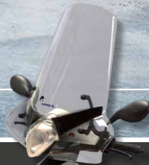
880AGE-SET Parabrisas para ONYX € 104,90