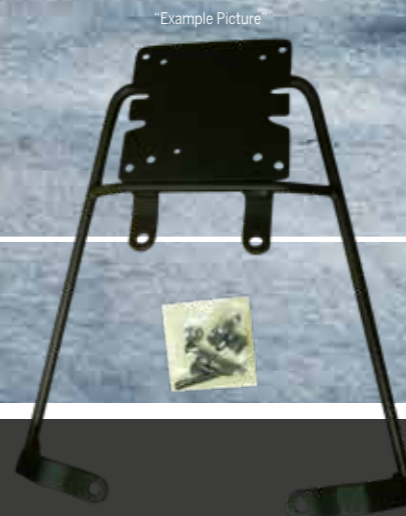
EXP-GT-110003 Código / desenfoque 125 porta-equipaje € 64,90