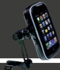
EXP-HH-100001 (8x14cm 4,3") EXP-HH-100002 (9x16cm 5,5") Porta-teléfono móvil para el montaje del espejo € 39,50